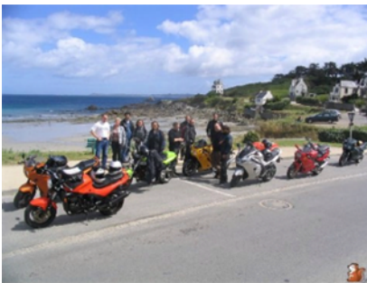
RAT Pack Cornouaille Moto

Et avec la rentrée, les Runs reprennent de plus belle ... Alors, en route !