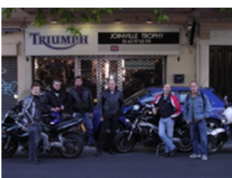
RAT Pack Joinville Trophy